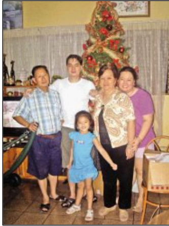
Parte de la familia. Reproducción de Róger Amoretty