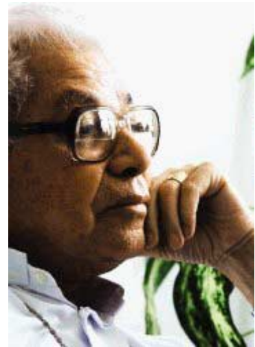
Monseñor Barquero dijo que ha advertido a los fieles.